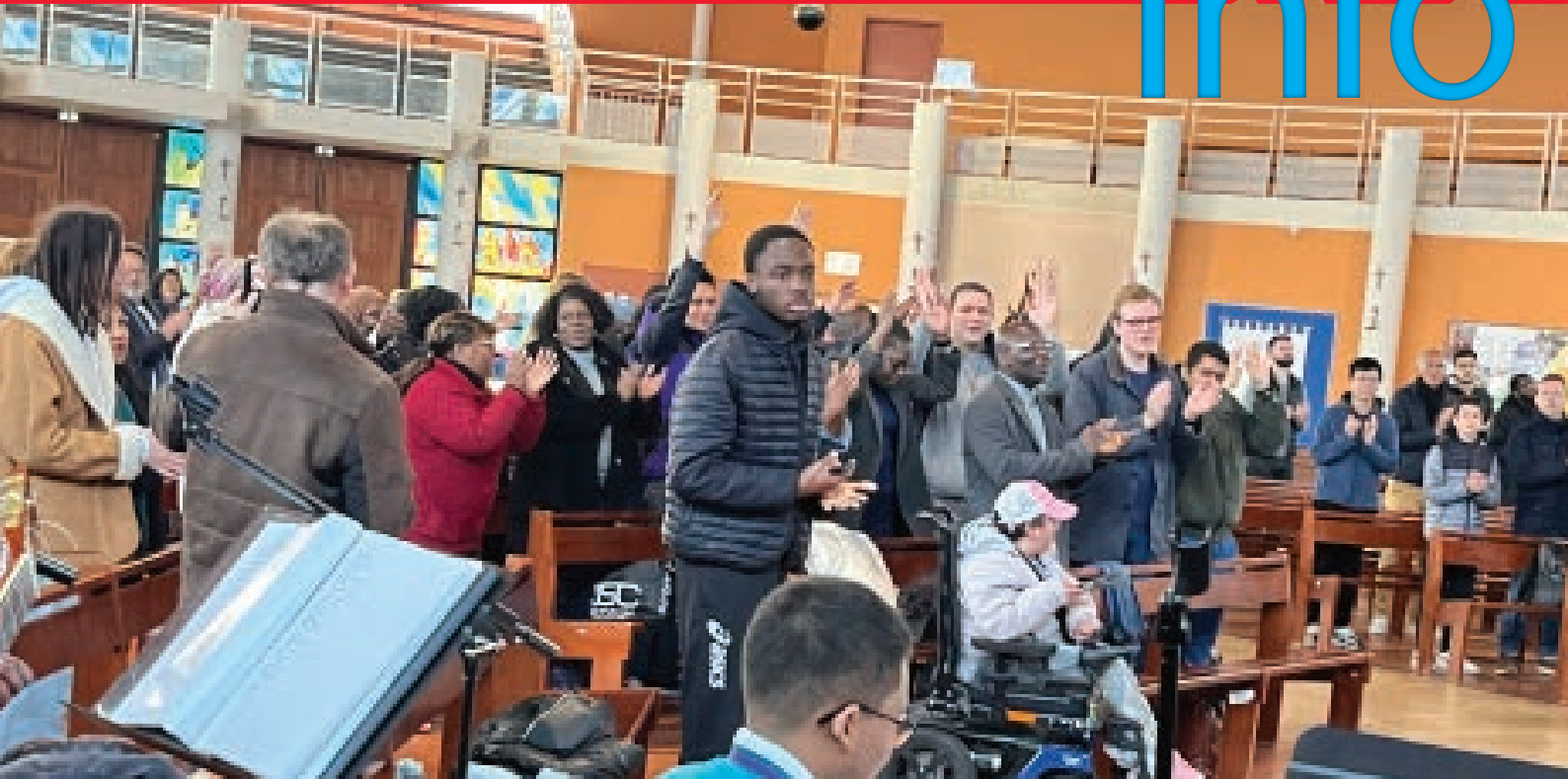
Veillée de louange et de témoignages samedi 20 avril