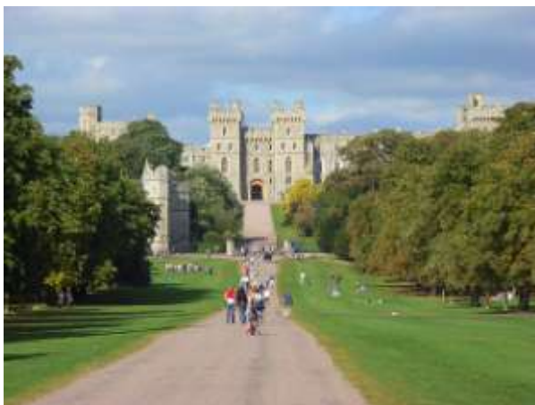
Le parc et le château de Windsor

familles, tout en continuant à soutenir les familles les plus fragiles. Le budget réel par jeune pour ce camp est de 610 €.