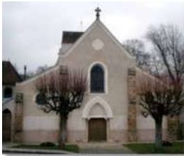
Gouvernes: 550 →1100

L'église Notre-Dame du Val et le centre pastoral rassemblent les fidèles du Val de Bussy depuis Noël 1998. Quinze ans plus tard, comment cela se passe-t-il dans les villages ? Pour faire vivre nos églises, l'enjeu est de créer des équipes de proximité.