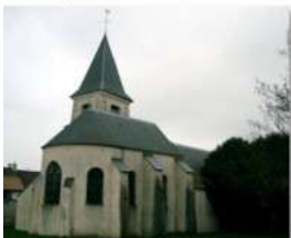
Collégien: 215 →3100

A Collégien , une équipe de proximité se réunit toutes les six semaines à l'église, avec le Père Bruno, pour préparer les messes, partager l'Évangile et faire le point de la vie locale.