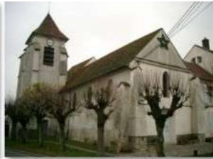
Conches: 400 →1800