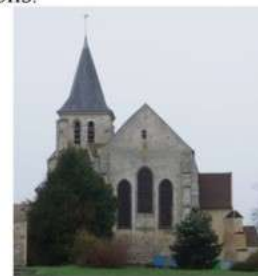
Montévrain: 860 →10000

L'église de Bussy Saint Martin est ouverte le dimanche après-midi de Pâques au 11 novembre, jour de la Saint Martin. L'association « Les Amis de l'Eglise de Bussy Saint Martin » est constituée de bénévoles laïcs qui se chargent de l'entretien, et de l'organisation de concerts, d'expositions et de conférences.