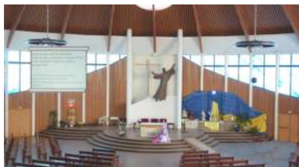
Projet à l'étude : écran déployé à gauche du chœur

L'installation d'un seul grand écran a la préférence car plus lisible, mais sa position doit respecter l'harmonie du chœur et éviter le contre-jour.