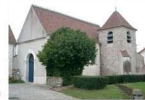
Chanteloup: 260 →2400

L'Association des « Amis de Saint-Eutrope », composée de chrétiens, s'occupe de la réfection et de l'entretien de l'intérieur de l'église (l'installation de la sono, par exemple). La vente de crêpes et de gâteaux le jour de la brocante, de couronnes de l'Avent au Marché de Noël, etc... permettent de financer les projets. L'équipe, qui se renouvelle cette année avec l'arrivée de nouveaux habitants, se réunit pour préparer les événements : les messes, Noël. En décembre, la crèche a été montée par les enfants du caté.