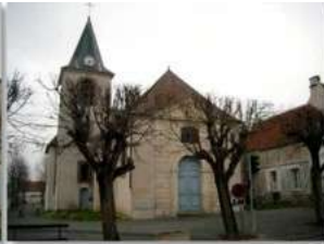
Guermantes: 175 →1400