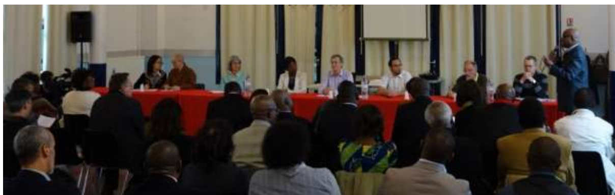
Les représentants des communautés religieuses de Bussy assis à la même table

Un comité de soutien interreligieux issu de cette conférence s'est constitué. Il s'engage à accompagner toute initiative de réconciliation et d'entente.