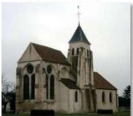
Bussy St Martin: 170 →730

« L'église de Saint Thibault est ouverte tous les samedis matin de 10h à 12h, sauf en juillet/août. Ouvrir l'église, ça veut dire nettoyer, accueillir. Environ 200 personnes ont poussé la porte de l'église en 2013, plus une centaine pour les journées du patrimoine. Quand les gens demandent des renseignements, nous les orientons vers l'accueil de la paroisse. » Guy