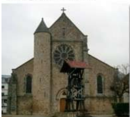
Ferrières: 800 →2400

A Collégien , une équipe de proximité se réunit toutes les six semaines à l'église, avec le Père Bruno, pour préparer les messes, partager l'Évangile et faire le point de la vie locale.