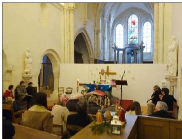
La messe est célébrée à l'église de Montévrain le 2 ème dimanche du mois

Contact : Sylvie et Laurent : 01 64 02 21 69