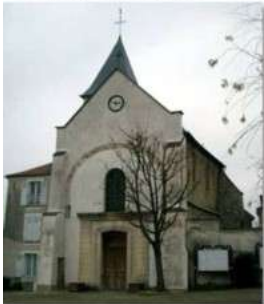
St Thibault: 740 →6500