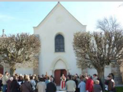
Eglise de Gouvernes

Après la venue des reliques de Thérèse de Lisieux et de ses parents, pour couronner l'année de la Famille dans