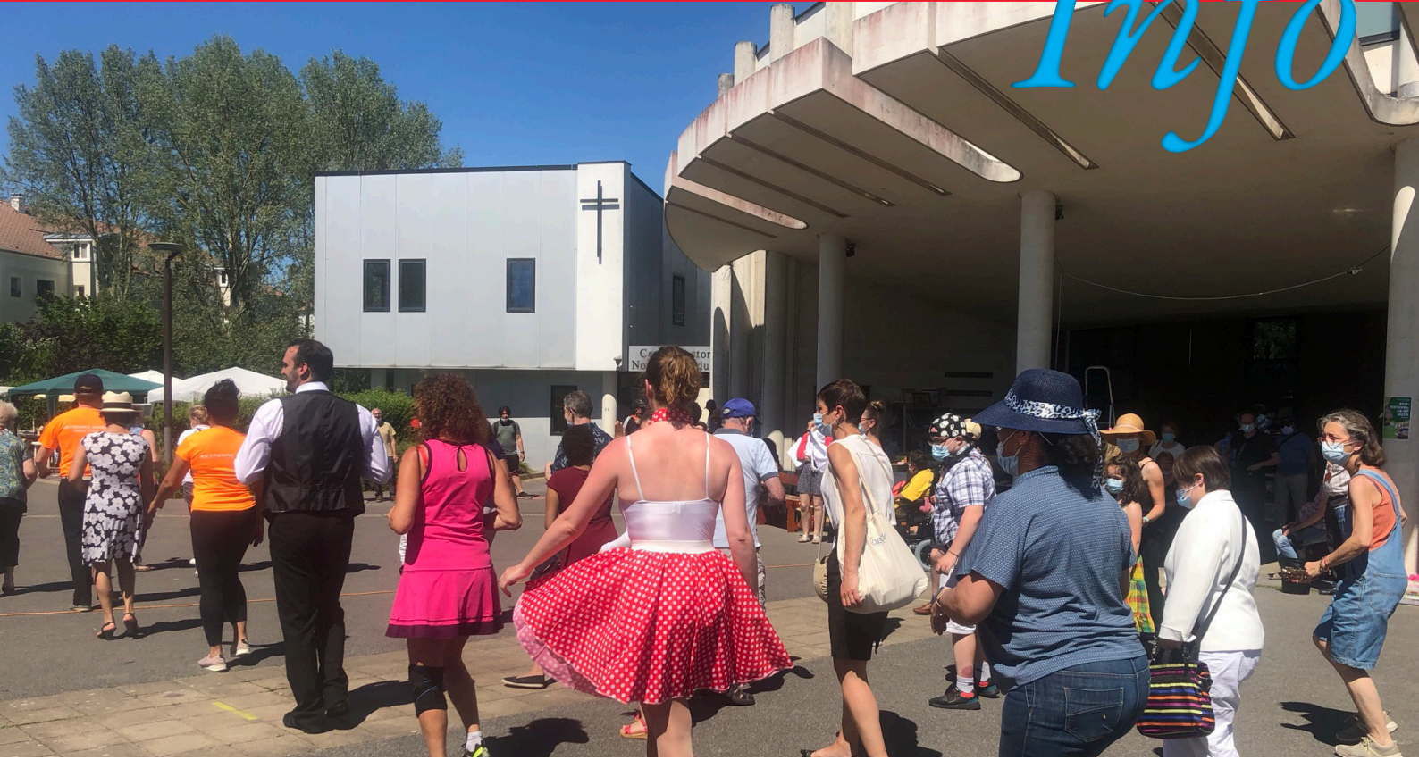
Braderie paroissiale 2021