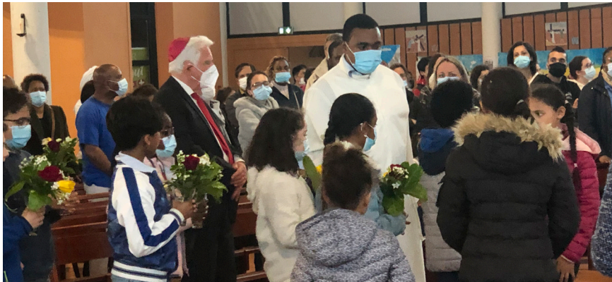
Messe du jeudi saint 2022