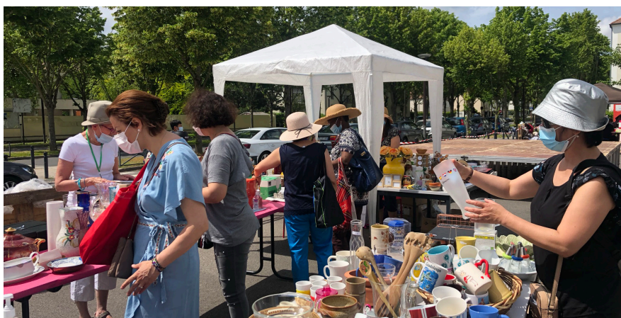
Braderie paroissiale 2021