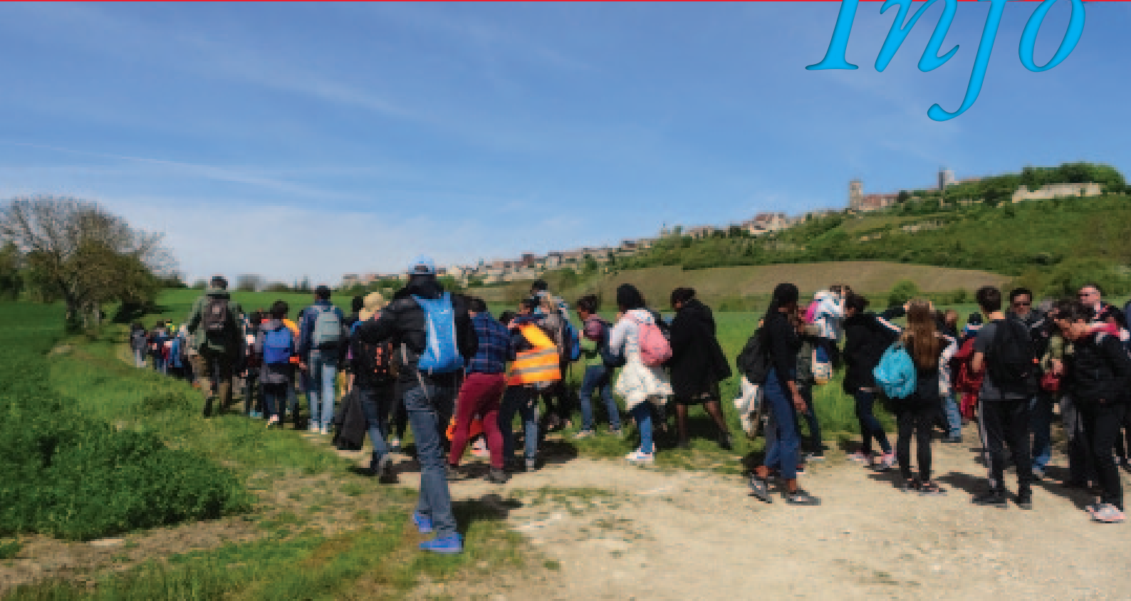
Marche vers Vézelay