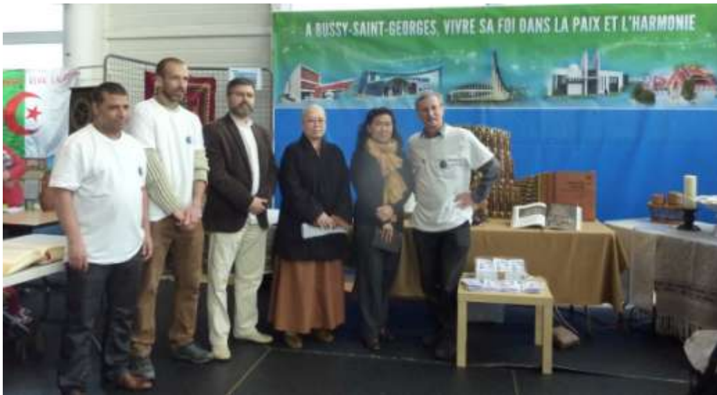
Le stand interreligieux au Monde en Fête

FETE DE L'ANNIVERSAIRE DE BOUDDHA A LA PAGODE FO GUANG SHAN