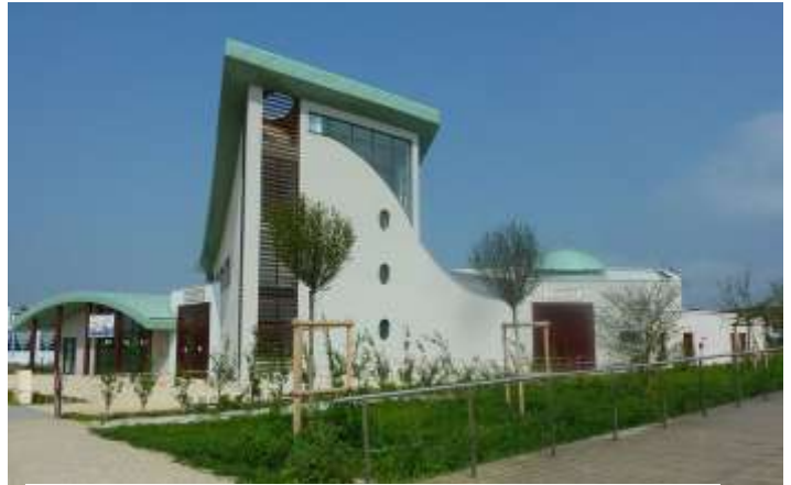
Après sept ans de conception et de travaux, la mosquée est inaugurée

Après l'instant officiel de la coupure du ruban, manière de symboliser l'accès à ce lieu et sa reconnaissance par tous, nous sommes invités à