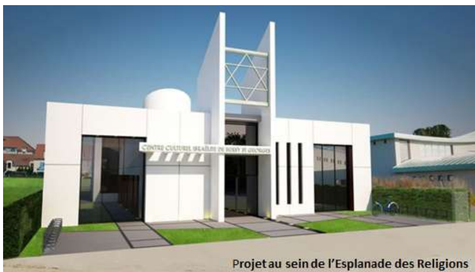
Projet au sein de l'Esplanade des Religions Le premier coup de pioche de la synagogue sera en 2014

Pour conclure, je voudrais citer Martin Luther King : "Nous devons apprendre à vivre ensemble comme des frères, sinon nous allons mourir tous ensemble comme des idiots."