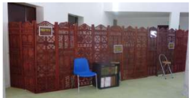
Le coin de femmes dans la salle de prière

Le Père Dominique Fontaine évoque la brise légère de Dieu qui souffle pour tisser des liens d'amitié. "Tout se fait dans la rencontre, sans stratégie. La paix et l'harmonie sont déjà là. Ce que nous vivons est une prévention de l'intégrisme. Aujourd'hui, face aux oppositions, la prière est notre force, à nous, communautés religieuses."