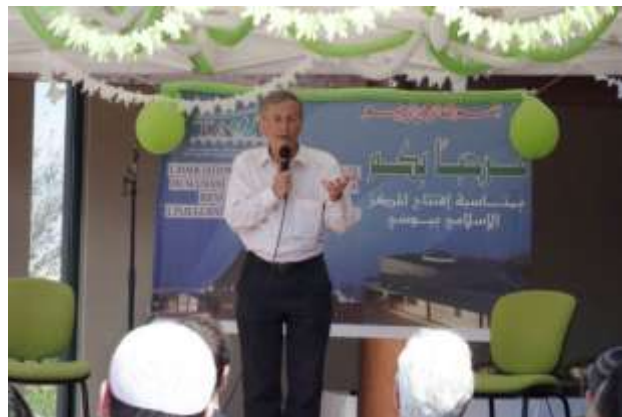
Les liens d'amitié, c'est comme une brise légère qui souffle