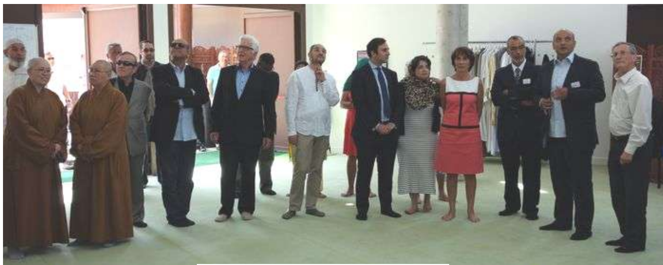
Les personnalités visitent la salle de prière