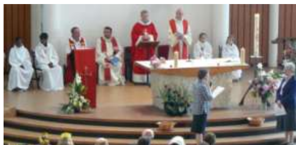
Aujourd'hui, je veux tout donner pour rejoindre le Christ dans le besoin de nos frères.