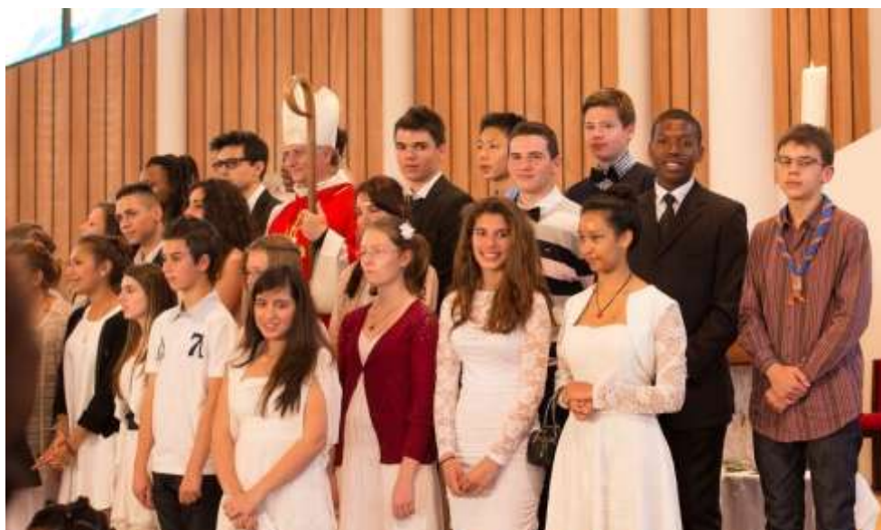
23 jeunes du pôle confirmés à Notre-Dame du Val

« Sois marqué de l'Esprit Saint, le Don de Dieu. »