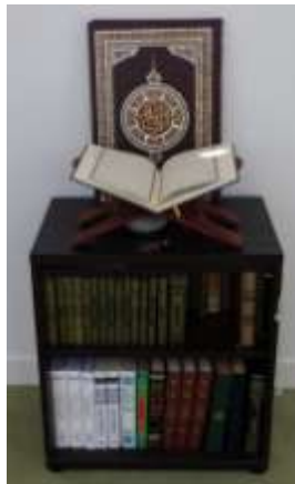
Les trois marches du minbar que l'Imam doit monter pour prêcher, et le Coran ouvert pour la prière