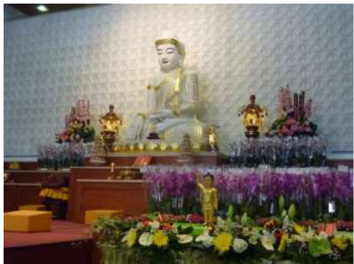
Anniversaire de la naissance de Bouddha à la pagode Fo Guang Shan