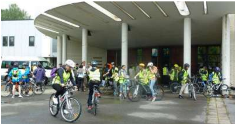
Oser s'engager dans un mouvement pour découvrir une part d'inconnu

Et pas des moindres. L'opération nécessite une tonne et demie de matériel (tentes, matériels de montages, ...), cinq cent kilos de consommations, et toute l'intendance nécessaire à son acheminement, ainsi que la participation active de nombreux parents pour assurer les repas, la surveillance de la plage, l'infirmier, les jeux, sans oublier le traitement technique des éventuelles avaries. L'an dernier, par exemple, nous avons traité 28 crevaisons, 4 chaînes cassées, un cadre cassé et de multiples réglages.