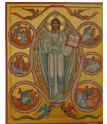
Icone de la Miséricorde

Pères D.F et B.S - La Miséricorde ne s'arrête pas à 2016. L'élan nouveau qui a été donné doit poursuivre son œuvre dans le cœur de chacun pour le bien de tous. La Miséricorde fait partie de toutes les religions, même si elles l'expriment différemment. Dans ce monde en mutation il y a des constantes spirituelles : la Miséricorde est de celles-là ! Qu'avons-nous perdu ? Tout à gagner ! ●