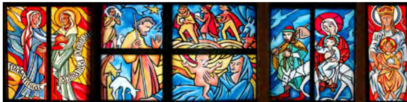
Les vitraux de Notre Dame du Val nous parlent du mystère de l'Incarnation : Marie enceinte rencontre la joie de sa cousine, la naissance de Jésus, Jésus migrant et persécuté dès sa naissance, et l'enfant dans les bras de sa mère.