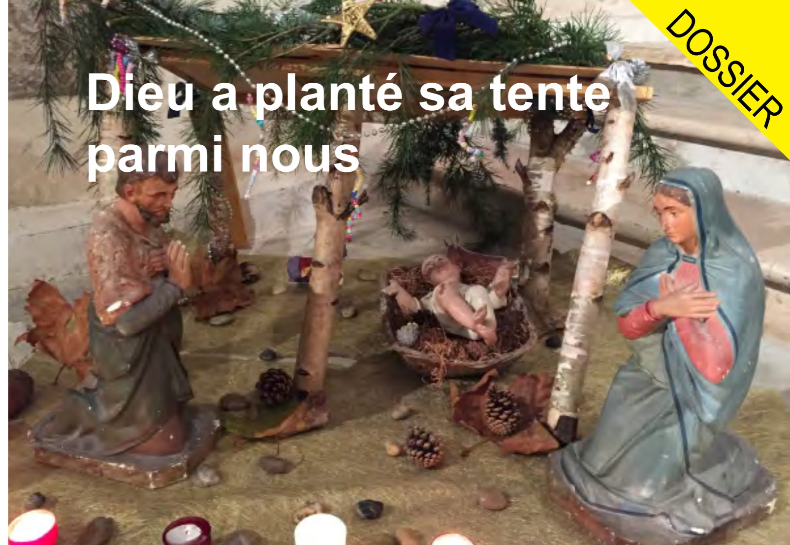
Crèche Bussy Village

Nouveauté - Des calendriers de l'Avent sont distribués dans chaque église au moment de l'installation de la crèche au début de l'Avent. Chaque enfant reçoit deux calendriers : un pour lui et l'autre à donner à un copain, un voisin... une occasion de parler de Jésus et de comment, au caté, à l'éveil à la foi, avec la communauté en Eglise, nous nous préparons à sa venue à Noël. Des calendriers supplémentaires sont disponibles pour les autres personnes de la communauté qui voudraient l'offrir à un enfant de leur entourage dans cet esprit missionnaire.