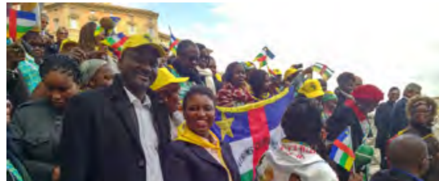
Délégation Centrafricaine à Rome