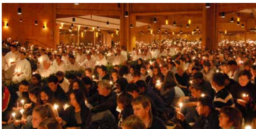
Taizé - Chacun se passe la flamme

Le soir, nous avons la possibilité de recevoir le sacrement de réconciliation. C'est un moment très fort et très important durant mon séjour. Aussi, je suis émue lorsque nous attendons plus d'une heure pour poser nos fronts sur