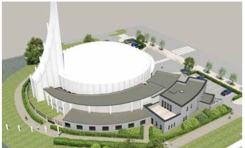
Perspective 3 D vue du ciel