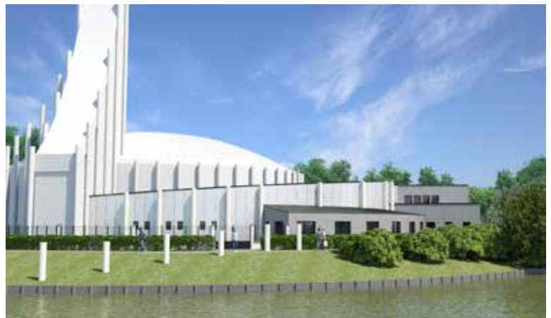
Perspective 3 D du lac