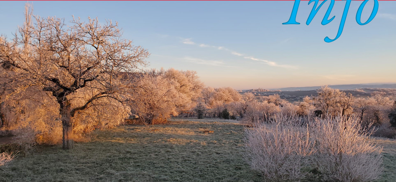
Paysage hivernal - Carmel de Vizille