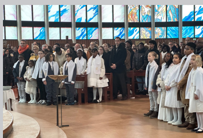
Baptême des enfants du KT

Le 12 janvier, 17 enfants du caté et de l'éveil à la foi se sont fait baptiser, félicitations à tous ! Les enfants étaient heureux et fiers de vivre enfin leur baptême. Bravo aux lecteurs et à tous les enfants qui ont fait preuve de patience tout au long de la célébration. Que Dieu continue de les fortifier et leur donner la grâce de leur transmettre son amour.