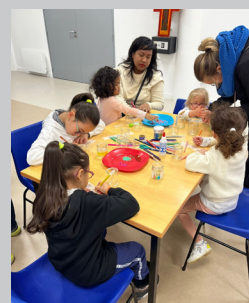
Les enfants fabriquent les couronnes

Les enfants de l'éveil à la foi se sont retrouvés pour fêter l'Epiphanie. Nous avons découvert les trois mages ainsi que les présents qu'ils ont apportés à l'enfant Jésus : il y a eu quelques difficultés pour prononcer le nom de tous les rois mages, mais nous avons ensuite fabriqué de belles couronnes avec des feutres, des paillettes, du scotch multicolore... Tout le monde a pu être roi ! Les enfants apprécient ce temps de bricolage qui leur permet de développer leur créativité. Nous terminons chacune de nos rencontres par un goûter et les enfants en profitent pour courir et jouer ensemble ! C'est si beau d'avoir des copains à l'église !