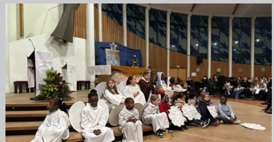
Crèche vivante à Notre Dame du Val