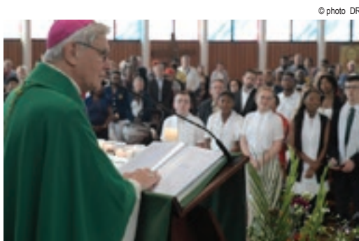
Confirmation des jeunes par Mgr Di Falco 18 juin