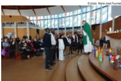
Sacrement des malades 11 février

Cette année encore, nous avons vécu beaucoup de temps forts qui ont marqué la vie de notre communauté. En voici quelques échos en images.