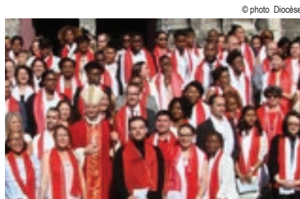
Confirmation des adultes à Meaux à la Pentecôte