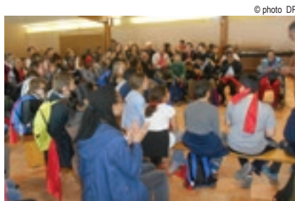
Pèlerinage Ars-Taizé 14-15 avril