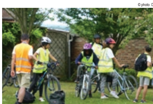
Camp missionnaire vélo du 1er au 5 juillet