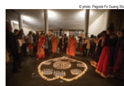
Gala pour la paix 13 octobre