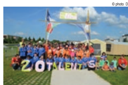
Les 20 ans du groupe scouts de Bussy 2-3 juin