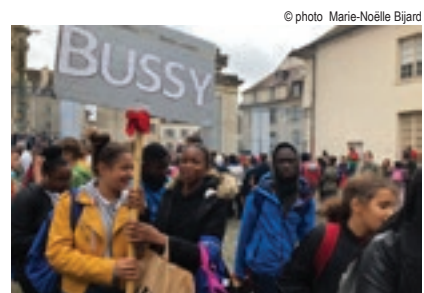
Envoi 2018 cathédrale de Meaux 23 septembre