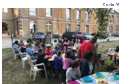
Rentrée de l'aumonie 14-15 septembre