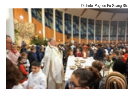
Messe de Noël avec l'évêque